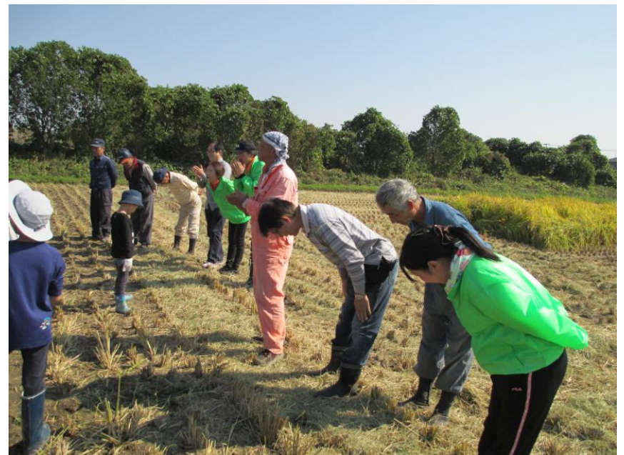
参加お礼のご挨拶