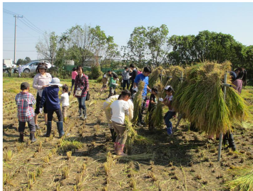
稲束を、七・三に分けて、できるかなあ・・