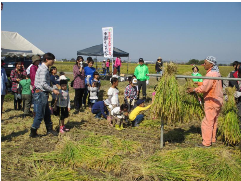
はぎ掛けのティーチングー「おうい、聞け！」