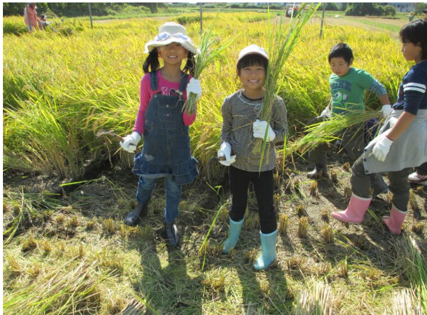
この笑顔を見て下さい