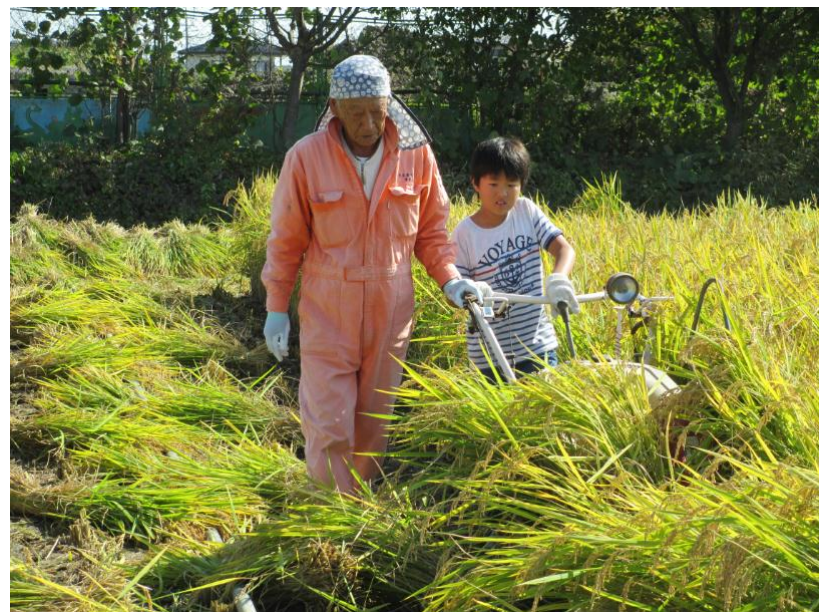
男の子はやっぱりコンバイン稲刈りが好き