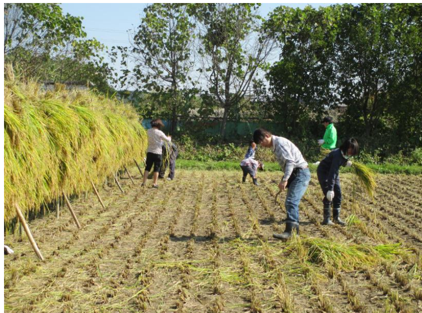
落穂拾い(みれーツ)