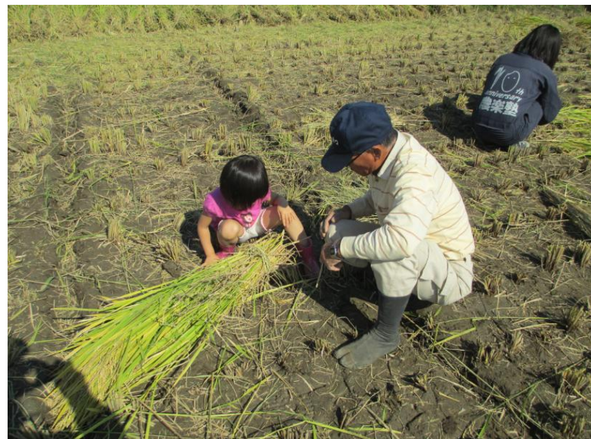
世代を超えた交流―「どう束ねるの？」