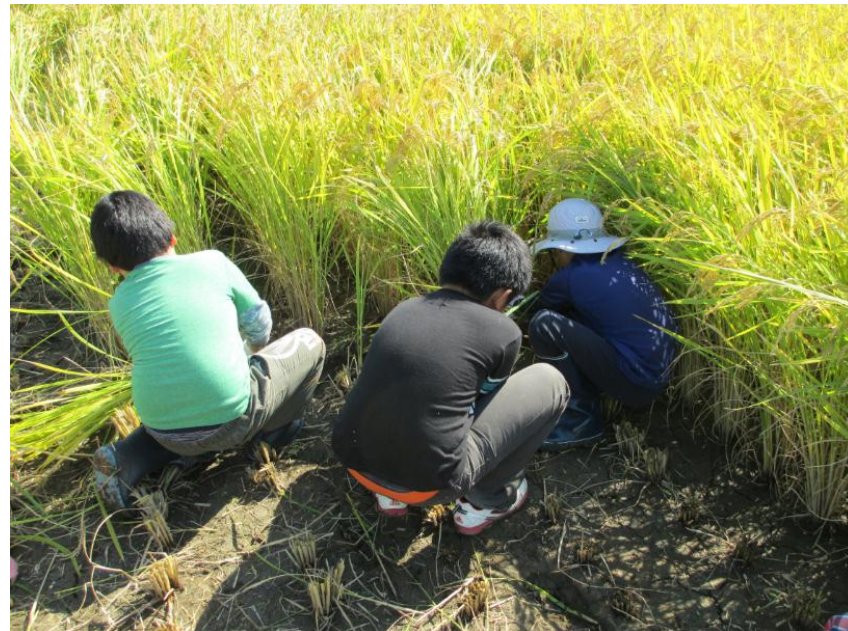
俺はもう5束刈ったぜ！