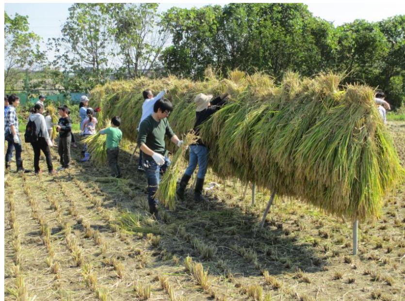
最後は、父・母の出番