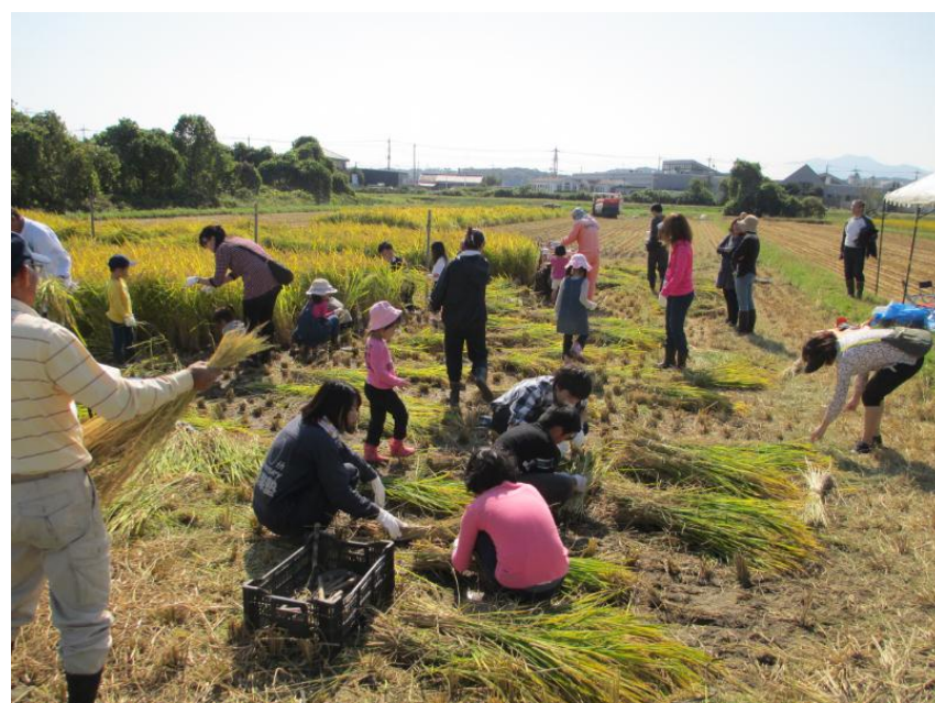
稲穂束ねにも挑戦しました