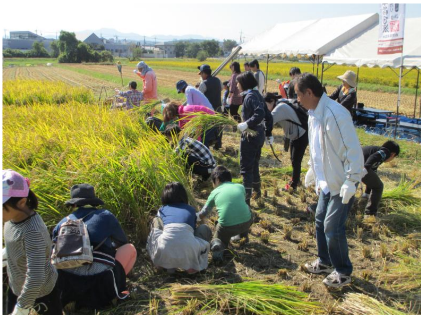
一斉に刈取り開始